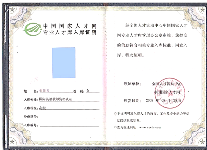
TESOL 国际英语教师专业人才证书