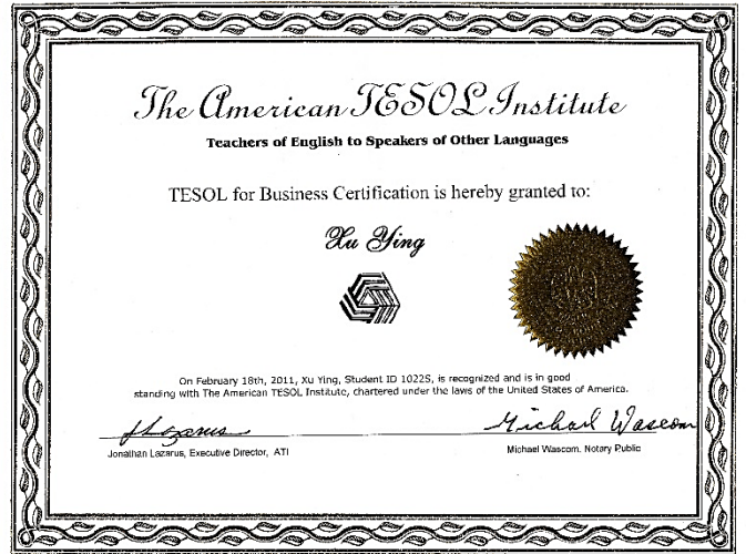
TESOL 国际商务英语教师证书(ATIBE)