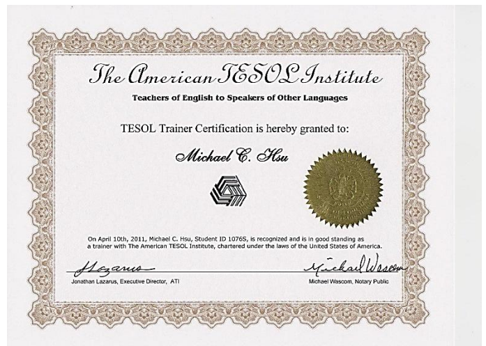
TESOL 国际英语教师培训师证书