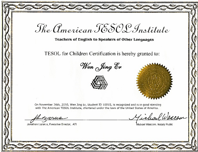
TESOL 国际少儿英语教师证书(ATICC)