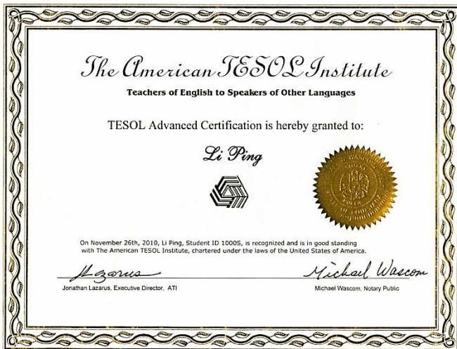
TESOL 国际高级英语教师证书(ATIAC)